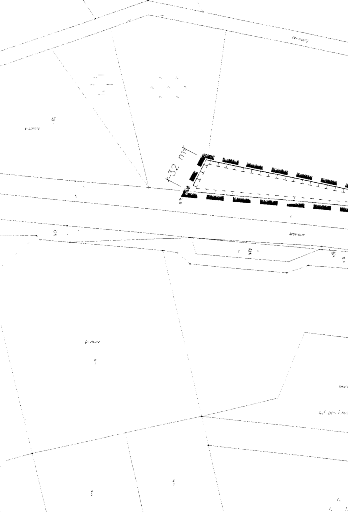
M. 1 : 2000